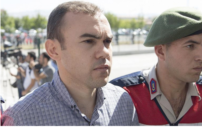
Ankara'yı bombalayan pilot: O gece uçmadım