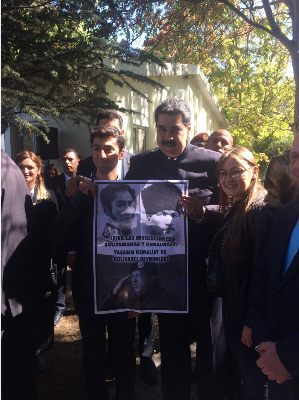
Maduro üzerinde "Yaşasın Kemalist ve Bolivarcı devrimler" yazan afişle poz verdi.

TGB'lilerle fotoğraf çektiren ve sohbet eden Maduro, "Tek Amerika yoktur. Biz, bizim Amerikamızdan geliyoruz. Biz devrimcilerin Amerikalılarız. Çekilen restlere karşı birlik içinde olmalıyız. Türkiye saldırılara göğüs geriyor. Biz de tekrar ediyoruz bundan sonra Amerika'ya rest çekenler kazanacak. Bu yüzyıl ezilenlerin kardeşçe yaşadığı bir yüzyıl olacak. Latin Amerika'daki tüm üniversitelerde Türkiye kürsüsü açalım. Buna da Chavez'in önem verdiği Bolivar Üniversitesi'nden başlayalım. Chavez anısına ülkeyi, halkı, kültürü tanıtmak iki ülke için de çok önemli. Ekonomi ve ticaret anlamında yapılacak işler var. İki ülke arasındaki ilişkileri geliştirmeliyiz." dedi.