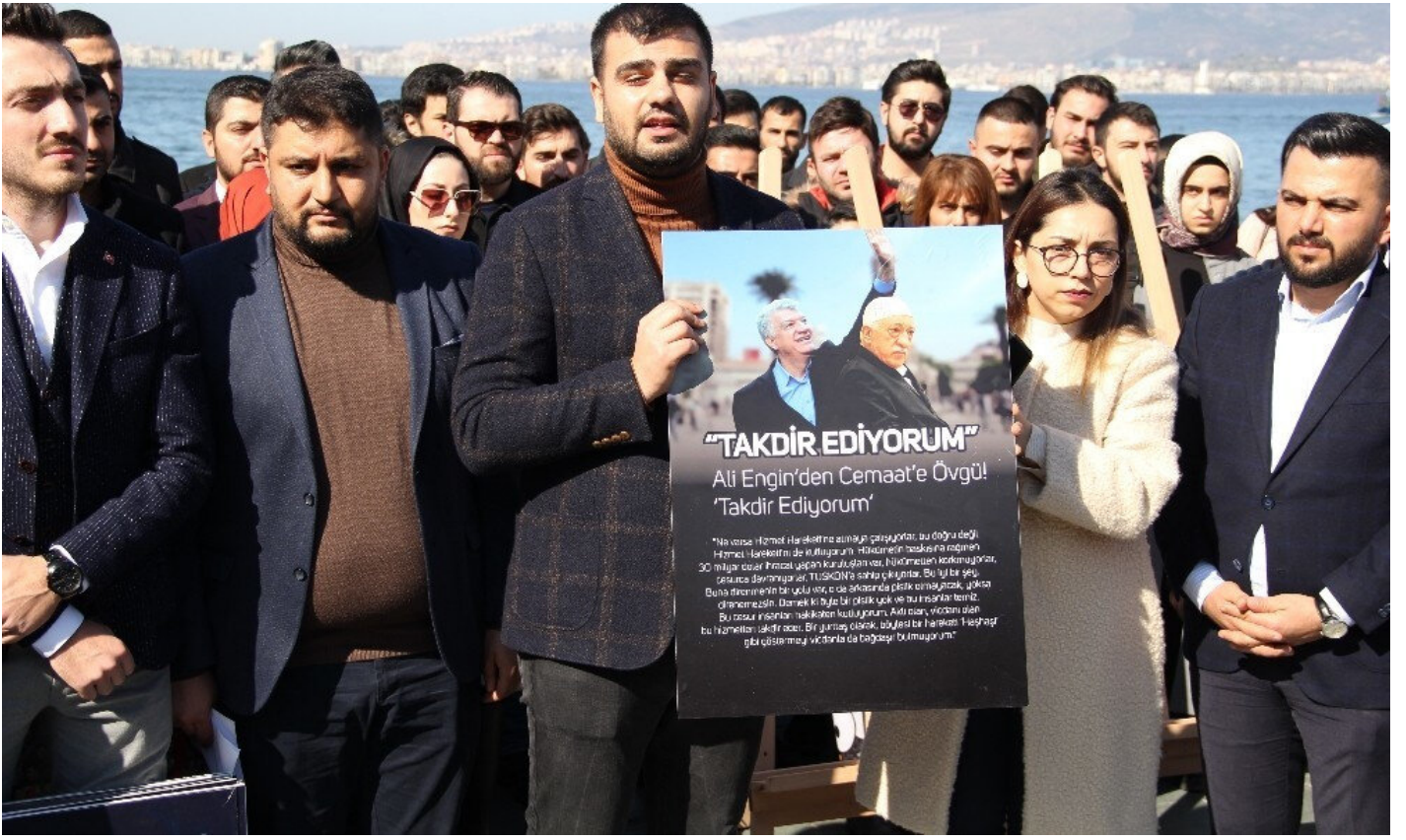
AK Parti İzmir İl Gençlik Kolları üyeleri, Cumhuriyet Meydanı'nda