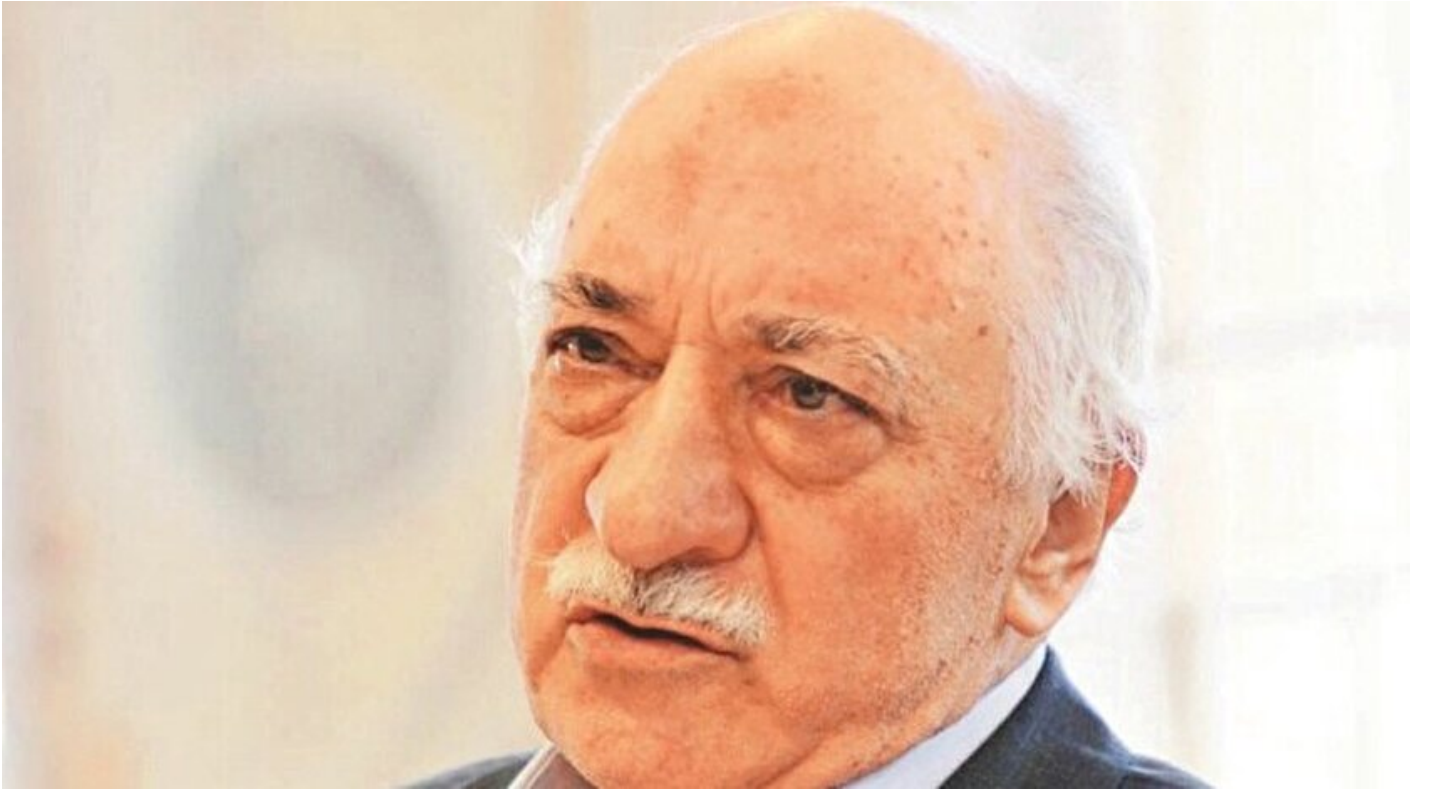
FETÖ elebaşı Fetullah Gülen