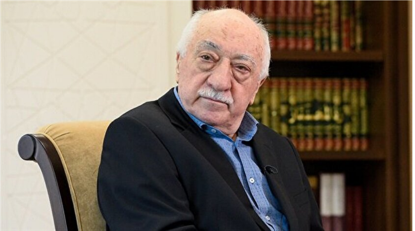
FETÖ yöneticisi Fetullah Gülen.

Haber Merkezi · 07 Şubat 2018, 11:21 · Son Güncelleme: 07 Şubat 2018, 11:26 · AA