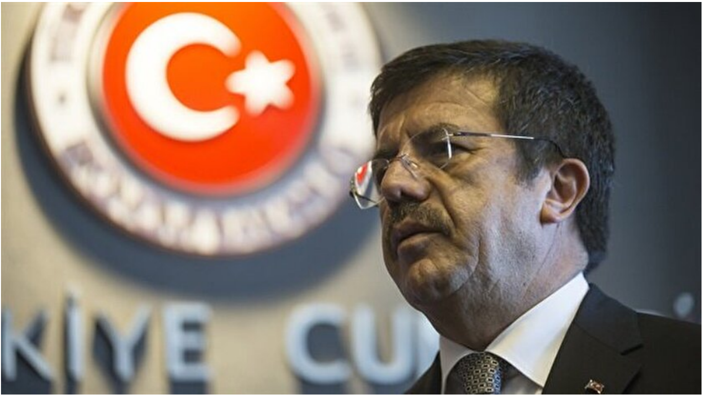
Ekonomi Bakanı Nihat Zeybekci

Haber Merkezi · 30 Eylül 2016, 15:30 · AA