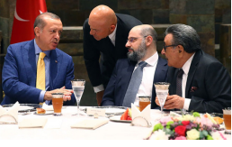
Erdoğan medya temsilcileriyle iftarda buluştu

Yerli ve Milli olarak milletimizin menfati olduğu yerde bana göre diğerleri teferruattır. Halkımızın moralinin yüksek tutulması sizlerle beraber olacaktır."