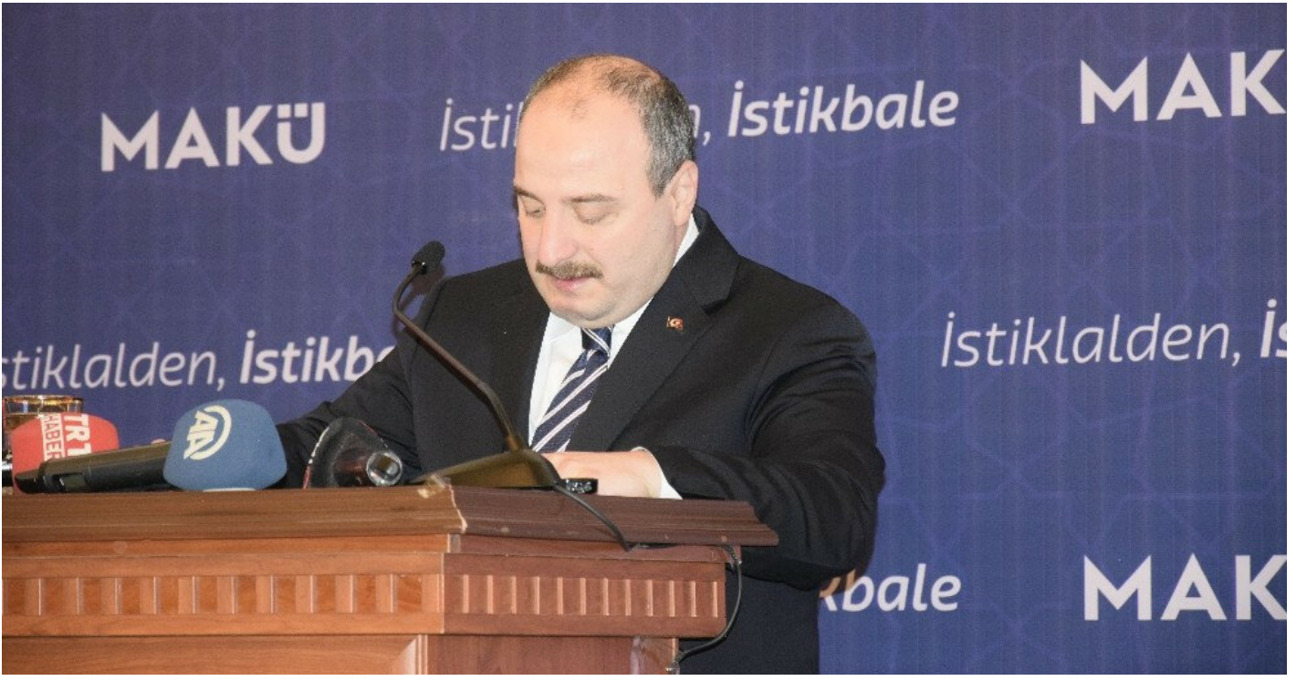
Sanayi ve Teknoloji Bakanı Mustafa Varank