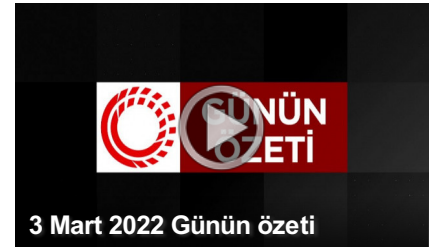
3 Mart 2022 Günün özeti