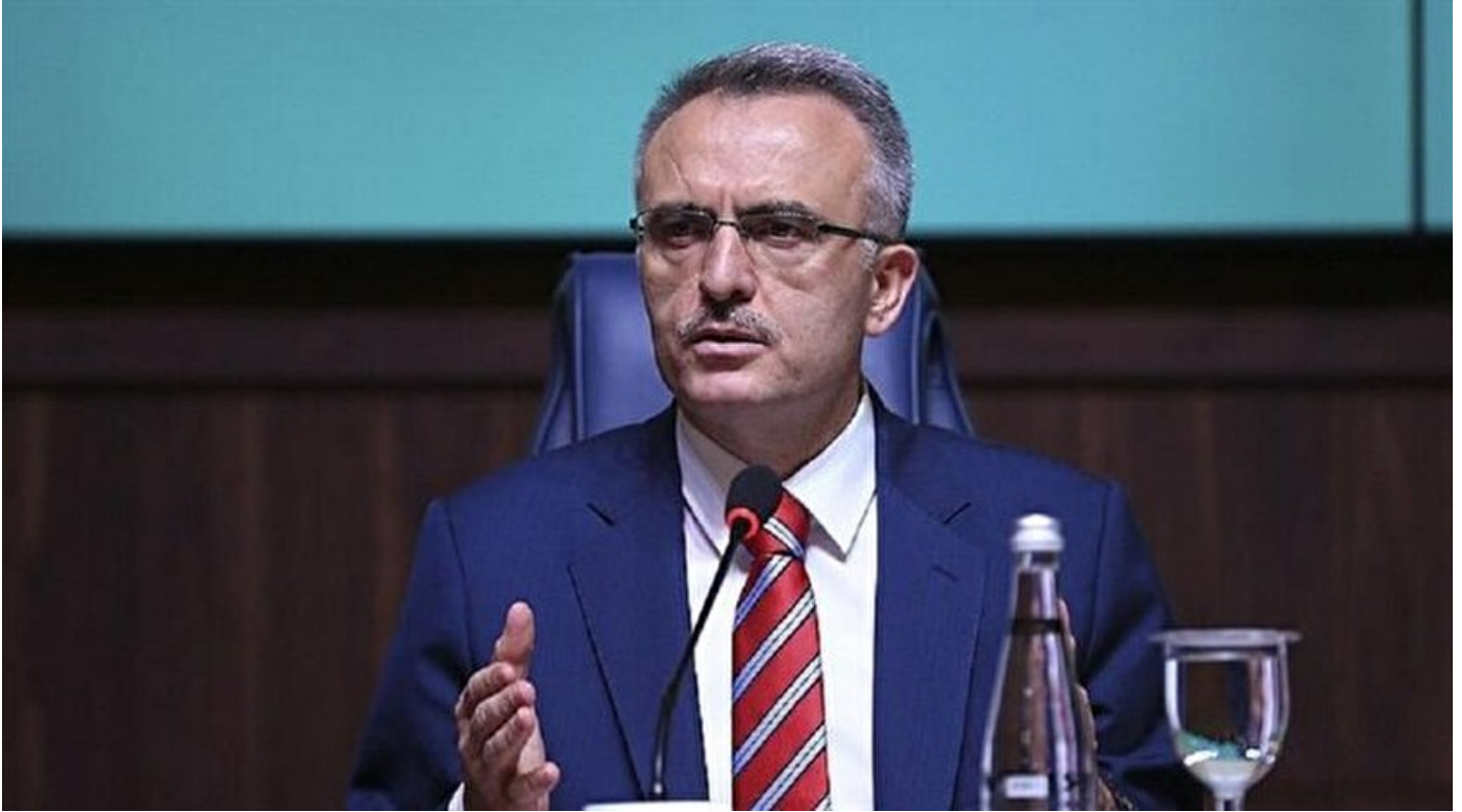
Maliye Bakanı Naci Ağbal

Haber Merkezi · 07 Ekim 2016, 12:30 · Son Güncelleme: 07 Ekim 2016, 14:23 · Yeni Şafak