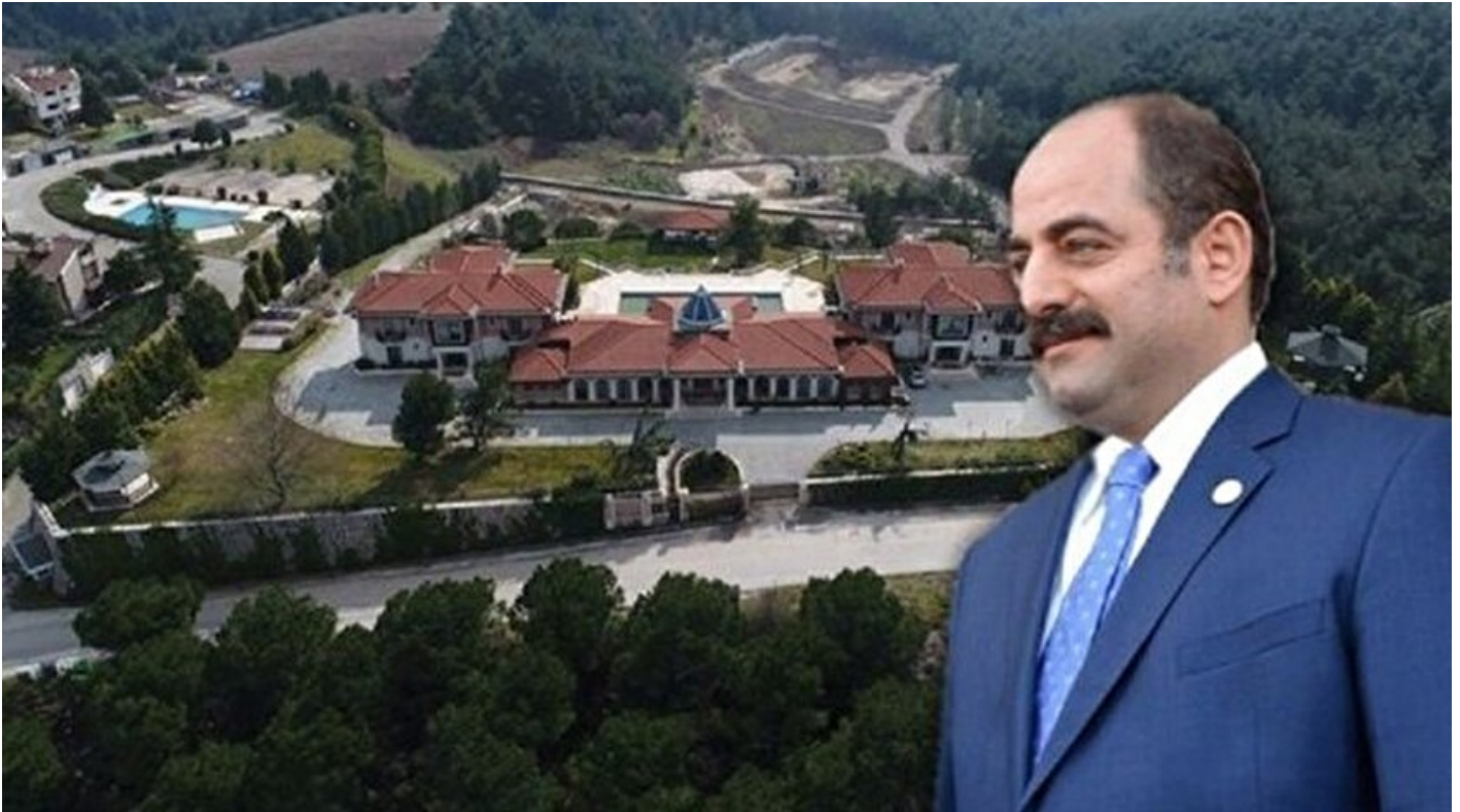
Firari FETÖ'cü Zekeriya Öz

Haber Merkezi 22 Mayıs 2018, 12:42 Son Güncelleme: 22 Mayıs 2018, 12:50 AA