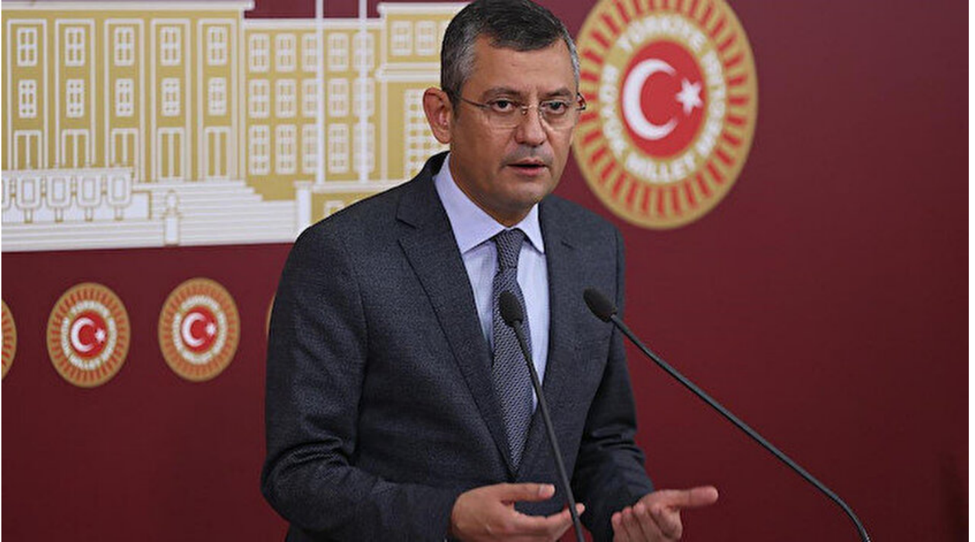
CHP Grup Başkanvekili Özgür Özel.