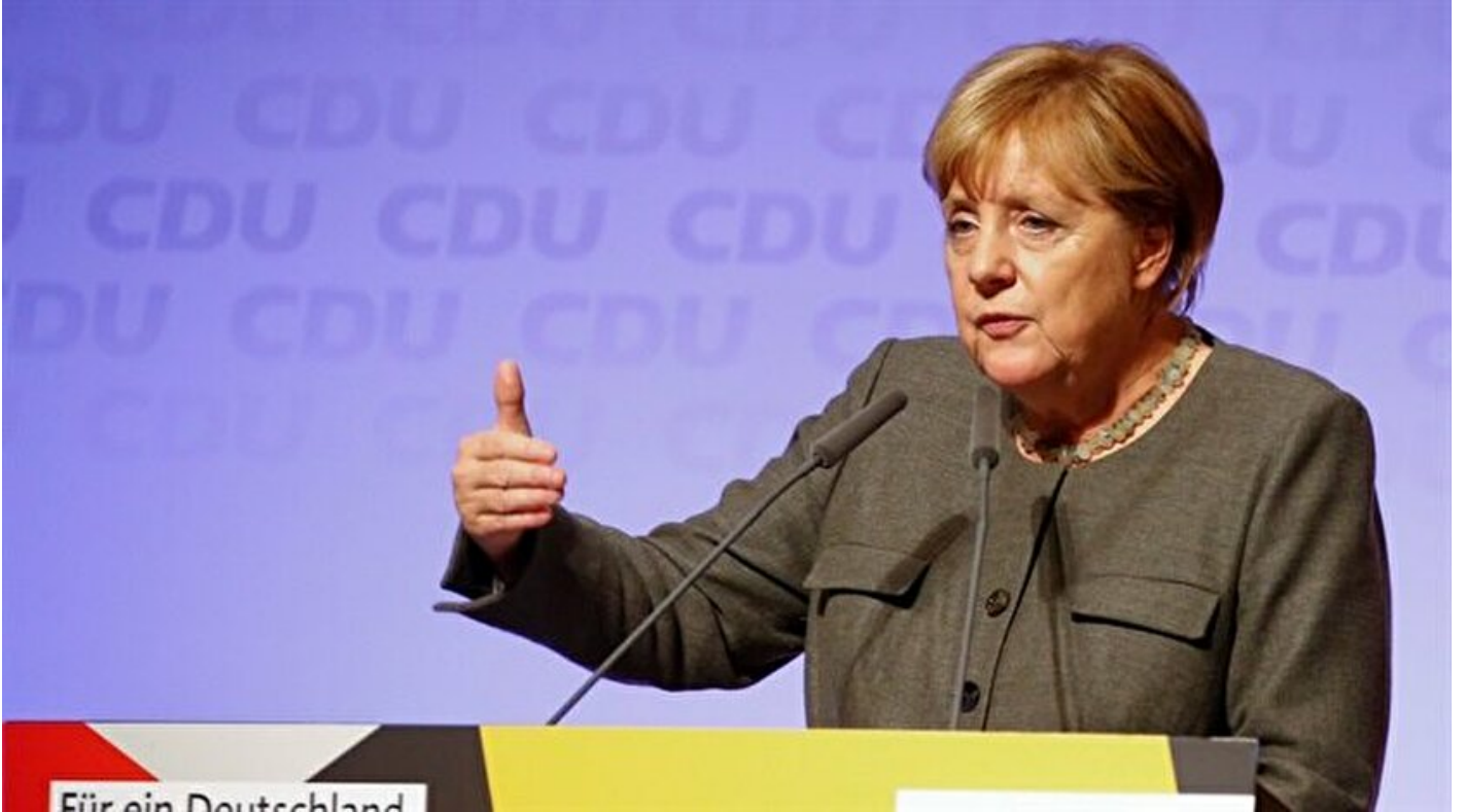
Almanya Başbakanı Angela Merkel

Haber Merkezi · 22 Eylül 2017, 10:35 · Son Güncelleme: 22 Eylül 2017, 11:03 · Yeni Şafak