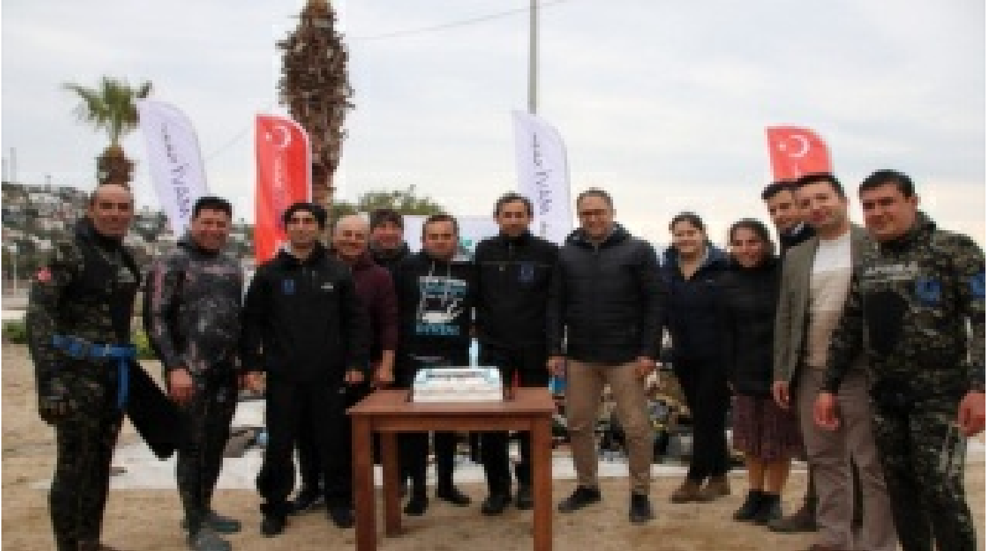
Dalgıçlar denizi, öğrenciler kıyıyı temizledi