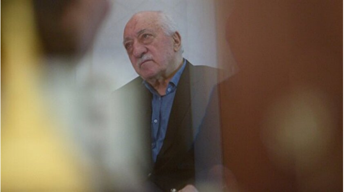
FETÖ elebaşı Fethullah Gülen

Haber Merkezi · 19 Aralık 2017, 08:54 · Son Güncelleme: 19 Aralık 2017, 17:48 · Diğer