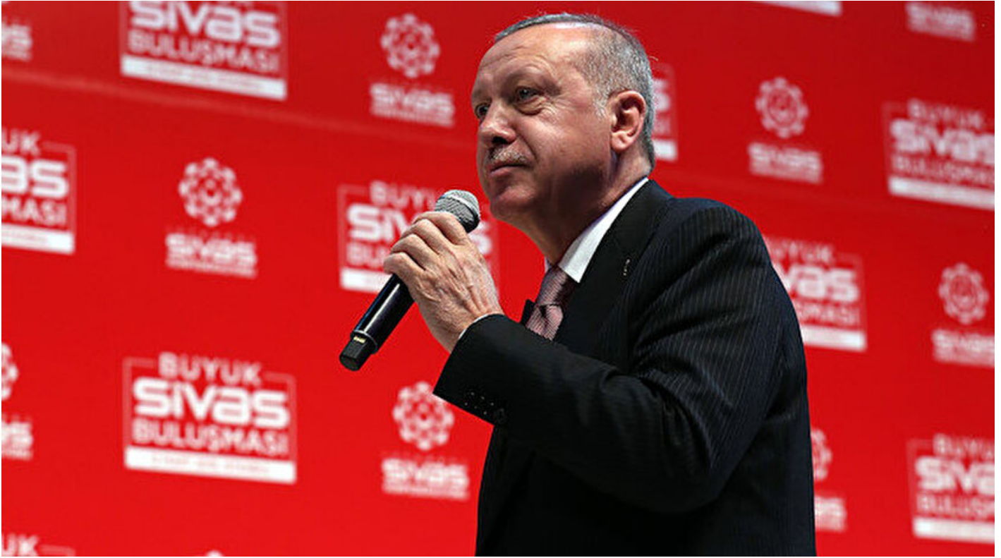
Cumhurbaşkanı Recep Tayyip Erdoğan