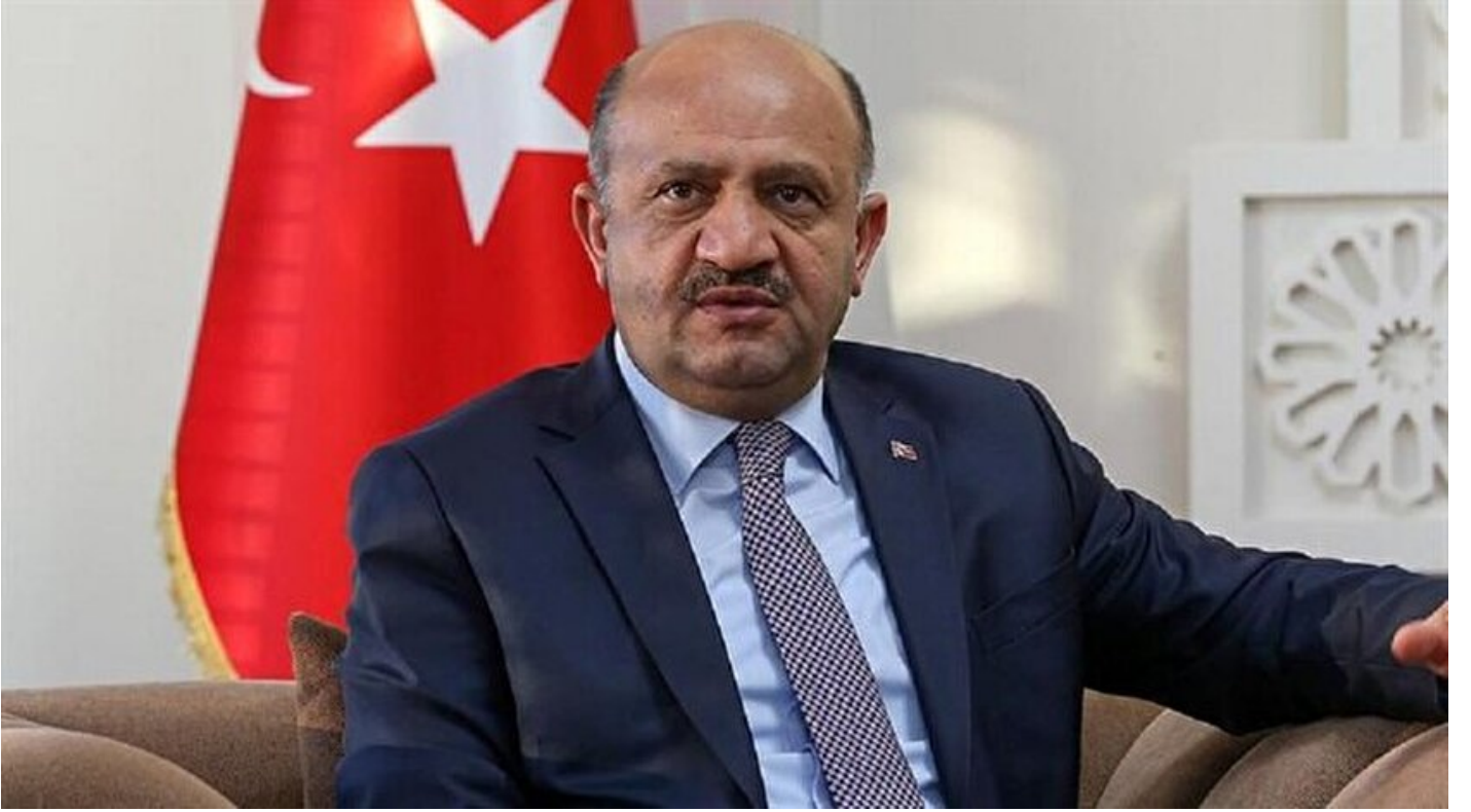
Başbakan Yardımcısı Fikri Işık

Haber Merkezi · 19 Haziran 2018, 11:52 · Son Güncelleme: 19 Haziran 2018, 12:18 · Diğer