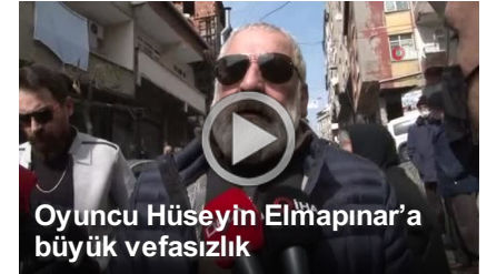
Oyuncu Hüseyin Elmâpınar'a büyük vefasızlık