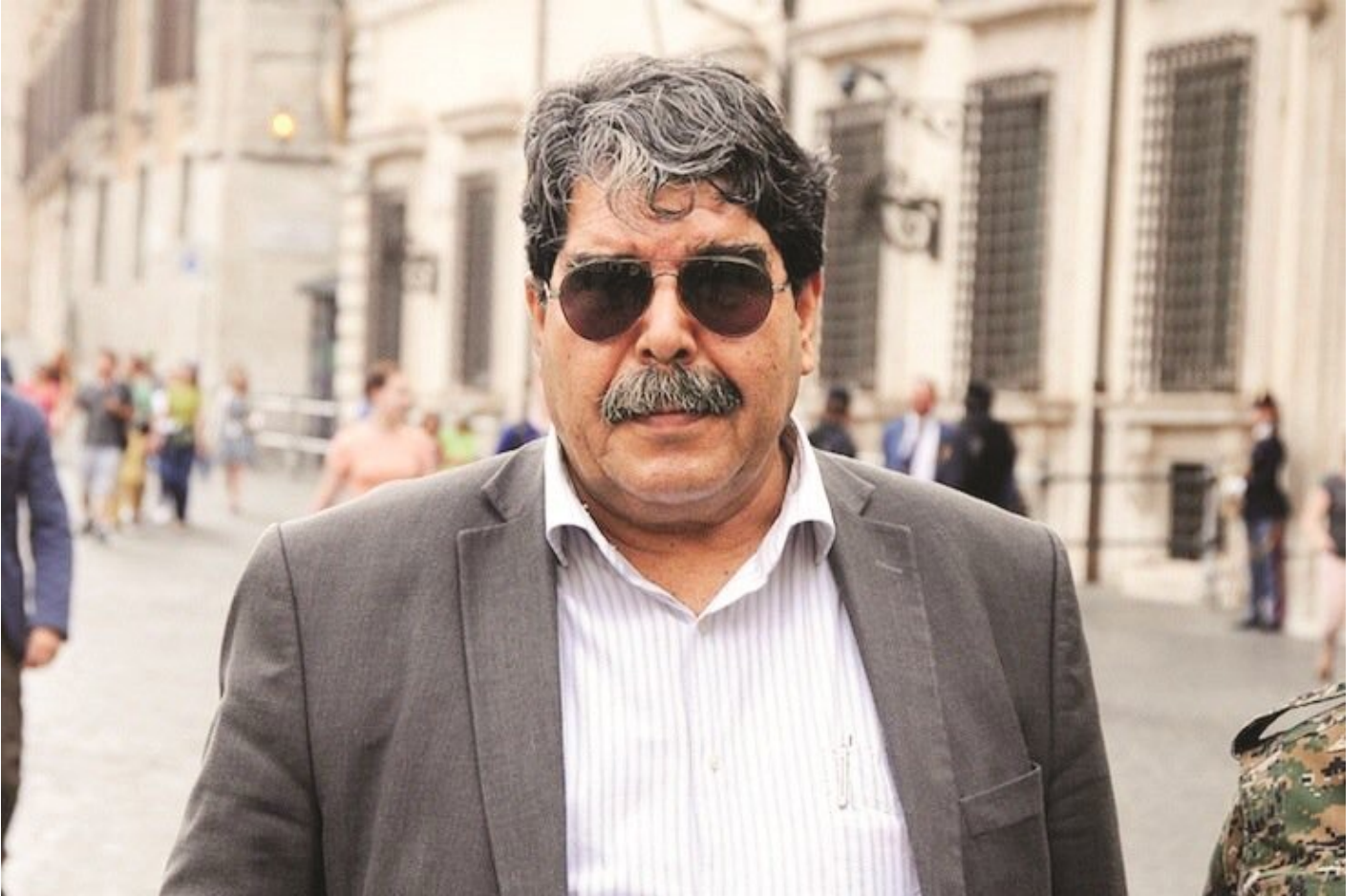
Suriye PKK'sını kurarak Türkiye sınırında terör kantonları oluşturan Salih Müslim

İsmi uzun süredir terörden arananlar listesinde kırmızı kategoride yer alan ve başına 4 milyon lira ödül konularak 'kırmızı bülten'le aranan Müslim için Ankara harekete geçti. Çekya Dışişleri ve Adalet Bakanlıkları ile temasa geçen Ankara, Müslim'in Türkiye'ye iadesi için hazırlanan kapsamlı dosyayı bugün Prag'a iletecek. Müslim, Ankara Merasim Sokak'ta 17 Şubat 2016'da meydana gelen saldırıda 29 vatandaşın yaşamını yitirdiği, 87 kişinin de yaralandığı terör saldırısının baş sorumluları arasında. Ankara 4. Ağır Ceza Mahkemesi'nce 'saldırının faili' sıfatıyla hakkında dava açılan Müslim'e 'devletin birliğini ve ülke bütünlüğünü bozma', 'nitelikli kasten öldürme', 'kasten öldürmeye teşebbüs', 'kamu malına zarar verme', 'mala zarar verme' ve 'tehlikeli maddeleri nakletme' gibi suçlar yöneltiliyor. Müslim ayrıca, 13 Mart 2016'da Ankara-Güvenpark'ta 36 kişinin ölümüne, 349 kişinin de yaralanmasına neden olan bombalı terör saldırısının da failleri arasında bulunuyor.