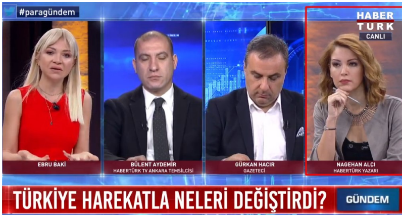
(24 Ekim - Habertürk TV - Para Gündem)