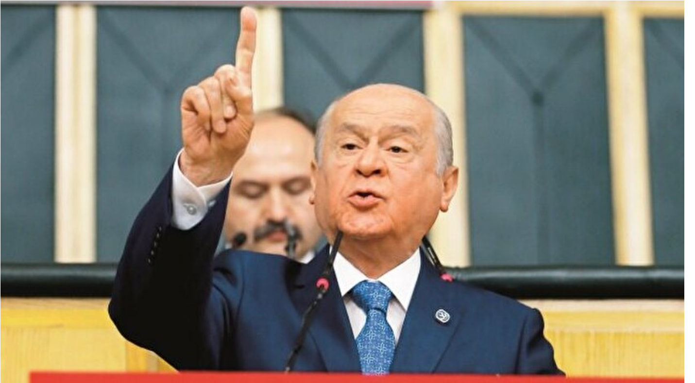
MHP lideri Bahçeli

Haber Merkezi · 19 Nisan 2017, 04:00 · Son Güncelleme: 19 Nisan 2017, 04:41 · Yeni Şafak