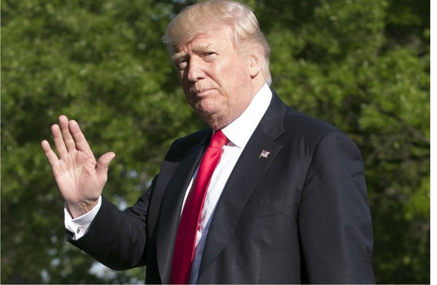
ABD Başkanı Donald Trump

Suriye'de PKK/PYD'ye silah yağdıran ABD, Başkan Donald Trump'ın onayladığı son kararlarla teröristlere doğrudan silah vermeye devam edecek.