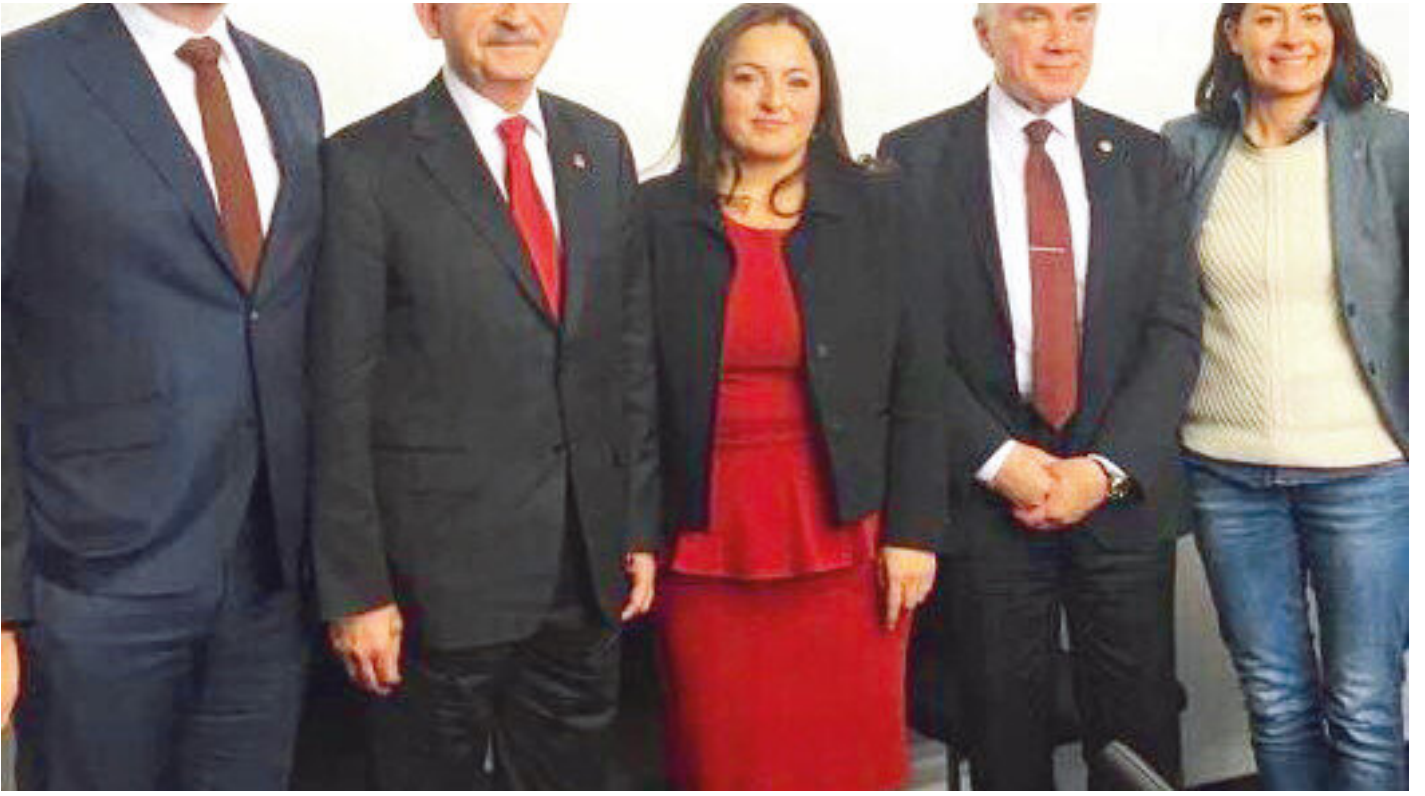
Kemal Kılıçdaroğlu, Almanya ziyaretinde terör örgütü PKK'nın destekçileri Sevim Dağdelen ve Evrim Sommer'le görüştü.