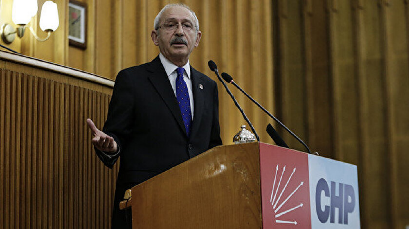
CHP lideri Kemal Kılıçdaroğlu