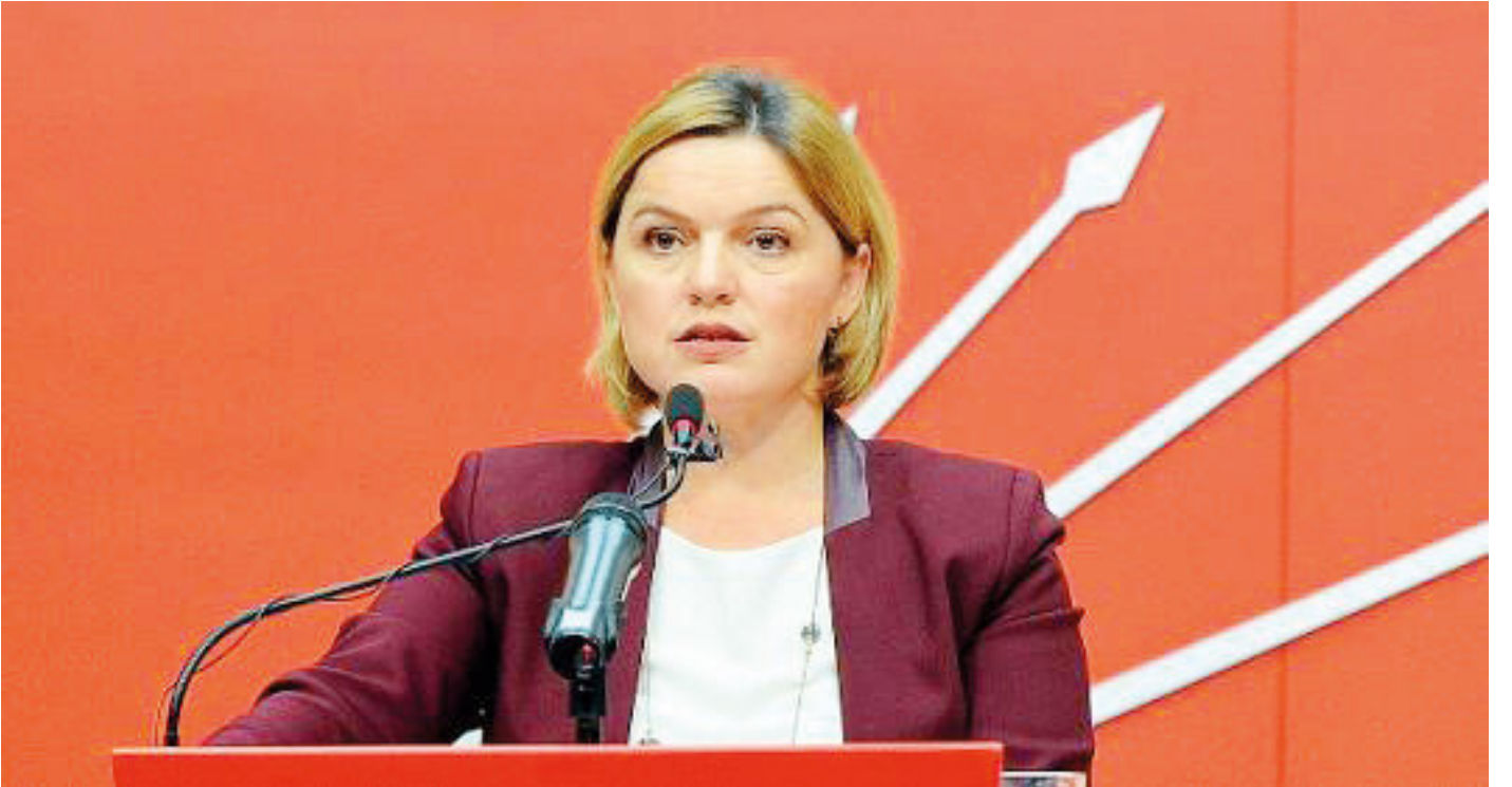
Selin Sayek Böke

Denizde arama kurtarma çalışmaları için 600 bin liraya alınan tekne CHP Kartal Belediye Başkanı Altınok Öz tarafından eşine tahsis edildi. CHP'li Belediye Başkanı'nın devletin paralarıyla aldığı tekneyi yardım amacıyla değil de eşinin özel işleri doğrultusunda kullandığı görüntüldü.