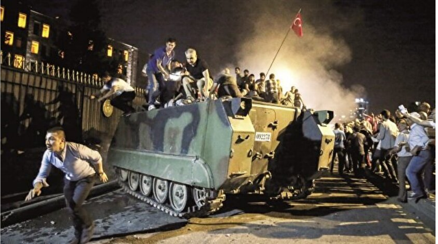
15 Temmuz FETÖ-NATO darbesidir

Kıymet Sezer · 13 Eylül 2017, 04:00 · Yeni Şafak