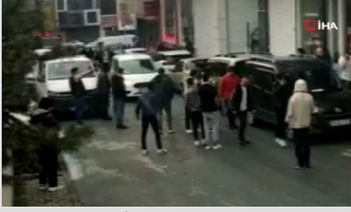
Uçan tekmeli kavga: Kaldırım taşları havada uçtu