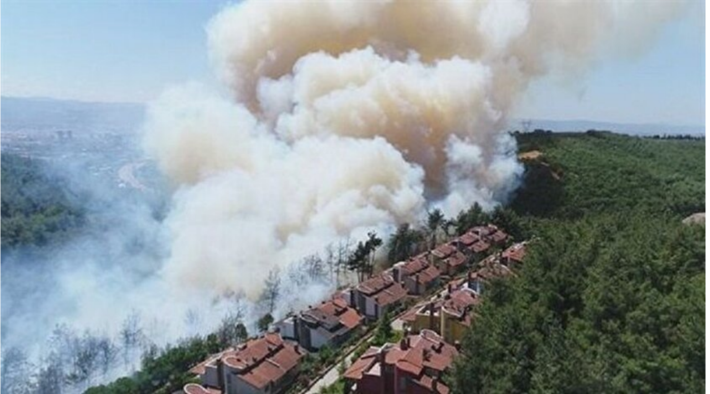
Bursa'da orman yangını