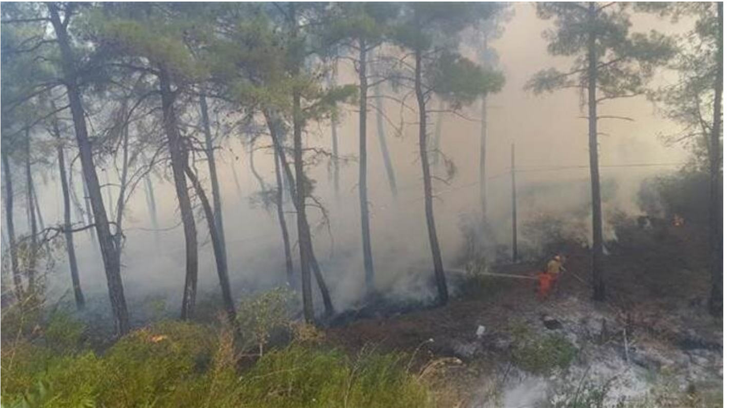
Antalya'da orman yangını

Oymapınar Mahallesi'ndeki ormanlık alanda henüz belirlenemeyen nedenle saat 11.00 sıralarında yangın çıktı. İhbar üzerine bölgeye çok sayıda ekip sevk edildi.