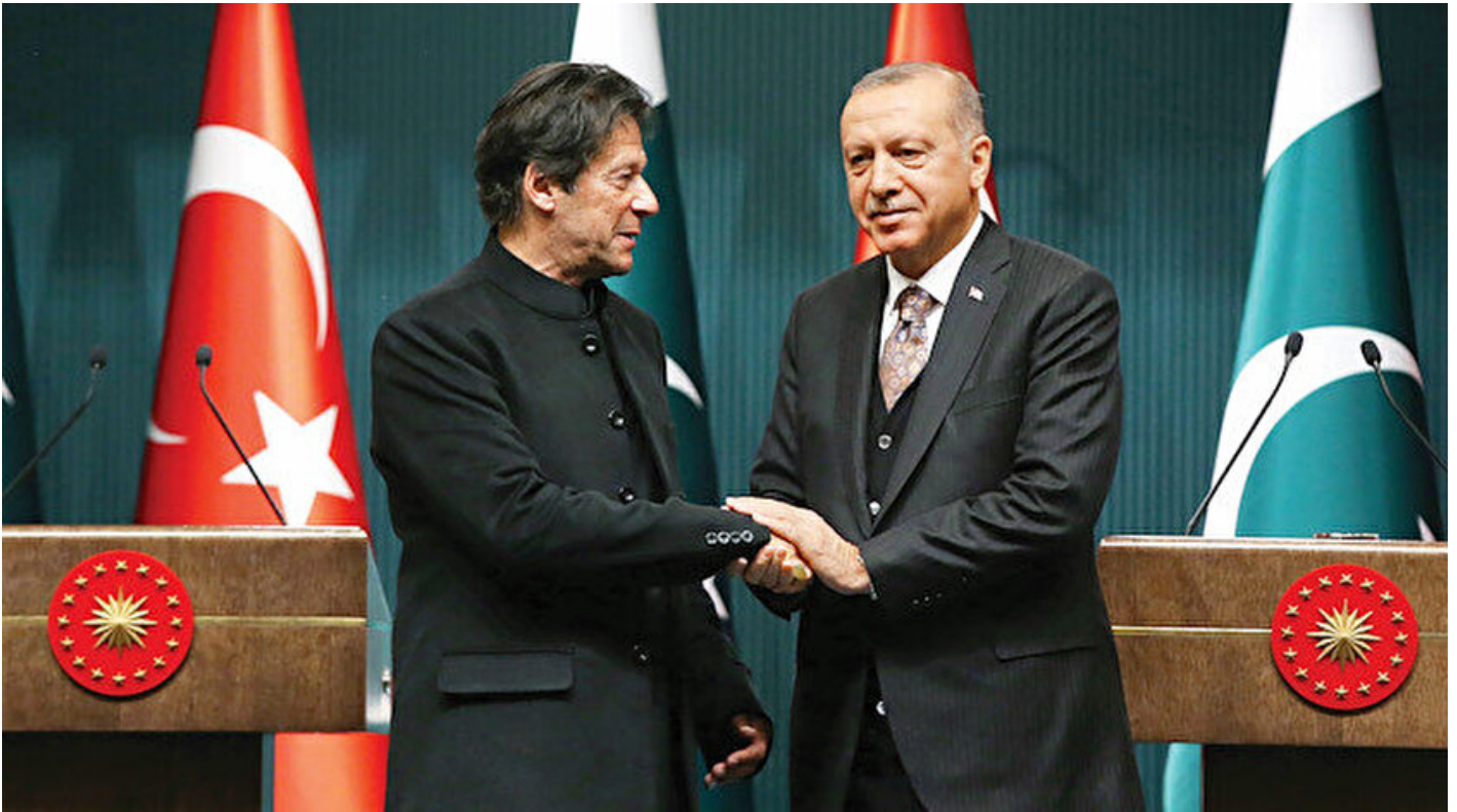
Recep Tayyip Erdoğan ve İmran Han

Haber Merkezi · 05 Ocak 2019, 04:00 · Yeni Şafak