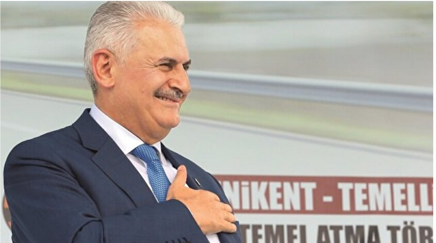
Başbakan Binali Yıldırım