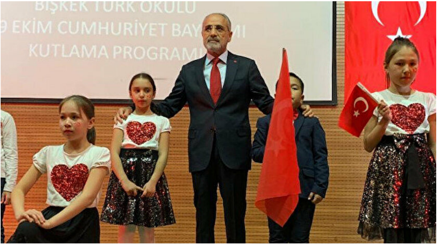
Cumhurbaşkanı Başdanışmanı Yalçın Topçu

Haber Merkezi · 30 Ekim 2019, 09:02 · Son Güncelleme: 30 Ekim 2019, 09:50 · Yeni Şafak