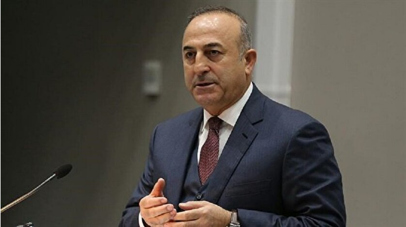
Dışişleri Bakanı Çavuşoğlu

Haber Merkezi · 04 Nisan 2017, 23:29 · Son Güncelleme: 04 Nisan 2017, 23:31 · AA