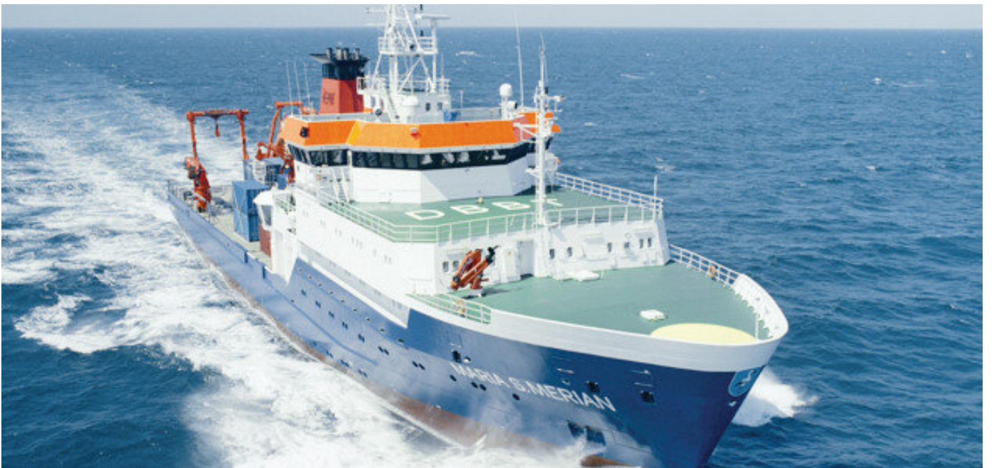
Alman Maria S Merian gemisi

İlk olarak geçen yıl şubat ayında, Cumhuriyet tarihinde ilk kez bir sondaj platformunun Türkiye deniz yetki alanlarında izinsiz faaliyeti engellendi. İtalyan ENİ firmasına ait Saipem 12000 sondaj gemisi, 3 numaralı parsel sınırında Türk savaş gemileri tarafından durduruldu. Doğu Akdeniz'de kriz yaratan bu olaya karşı Türkiye direnince İtalyanlar, KKTC ve Türkiye'yi muhatap almak zorunda kaldı.