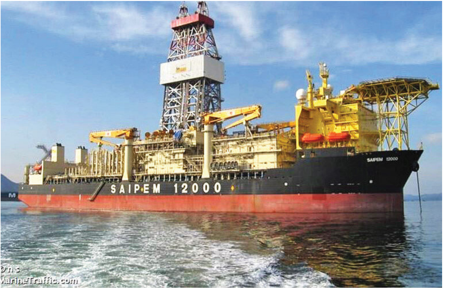
İtalyan Saipem 12000 sondaj gemisi