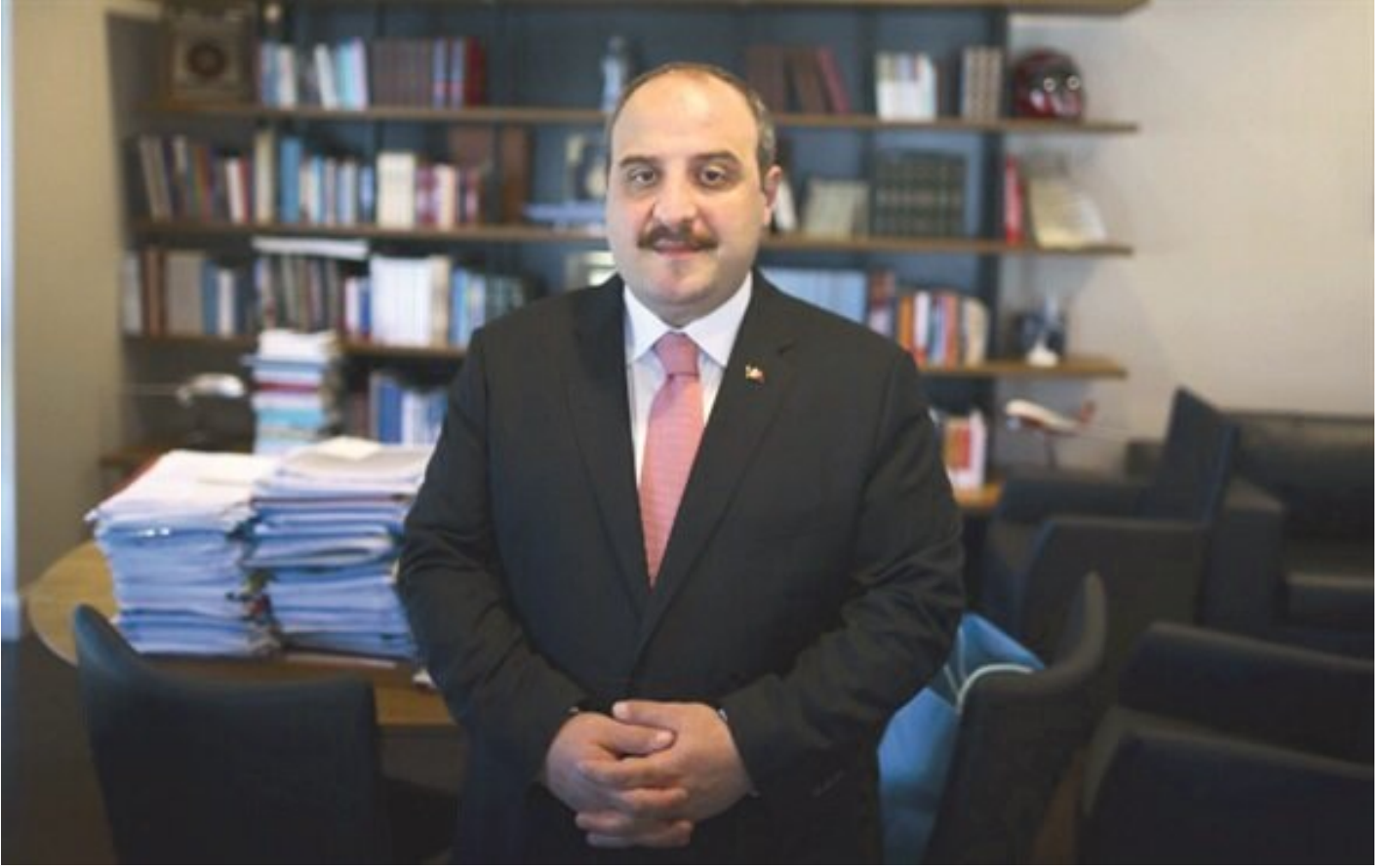
Sanayi ve Teknoloji Bakanı Mustafa Varank

gövdasını siper etmesi sayesinde alçak darbe girişimi durduruldu" ifadelerini kullandı.