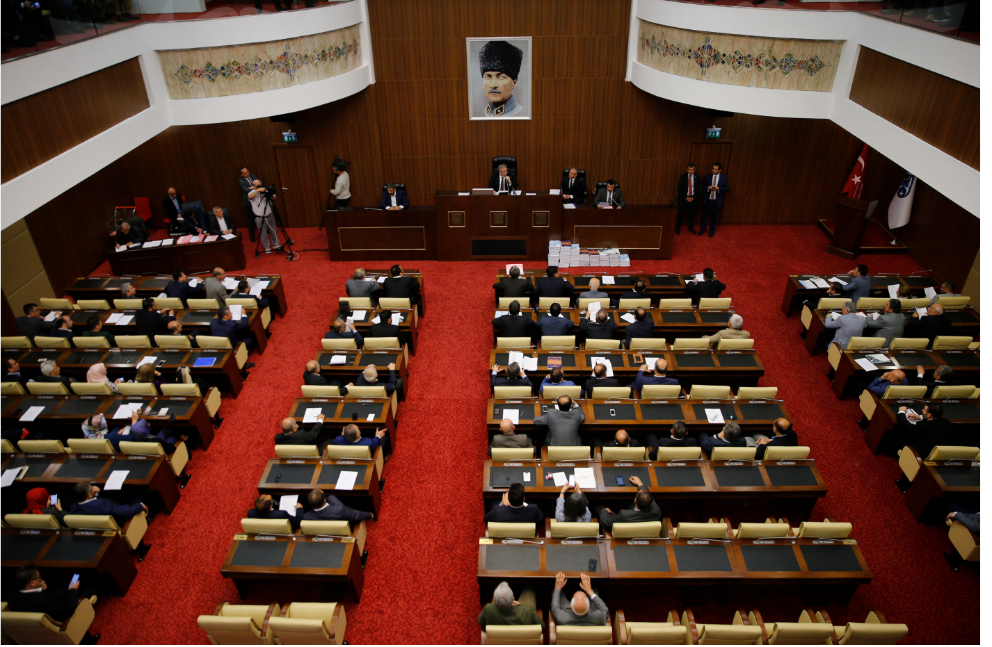
Ankara BB Meclis Toplantısı.