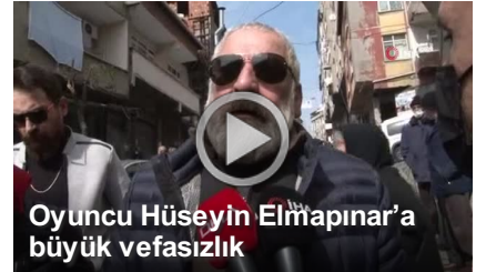
Oyuncu Hüseyin Elmâpınar'a büyük vefasızlık