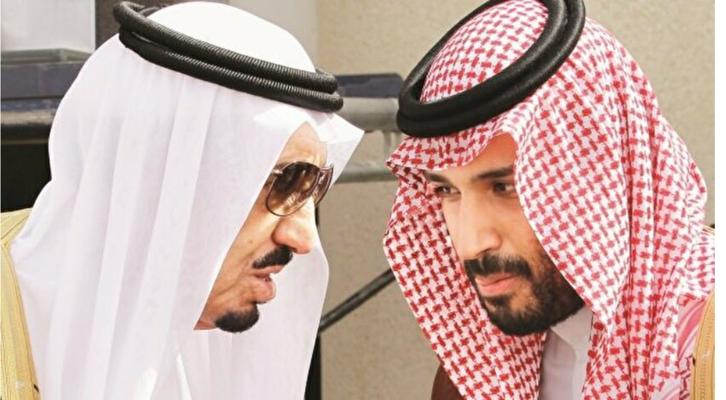
Selman bin Abdülaziz - Muhammed bin Selman

Haber Merkezi · 14 Aralık 2017, 04:00 · Yeni Şafak