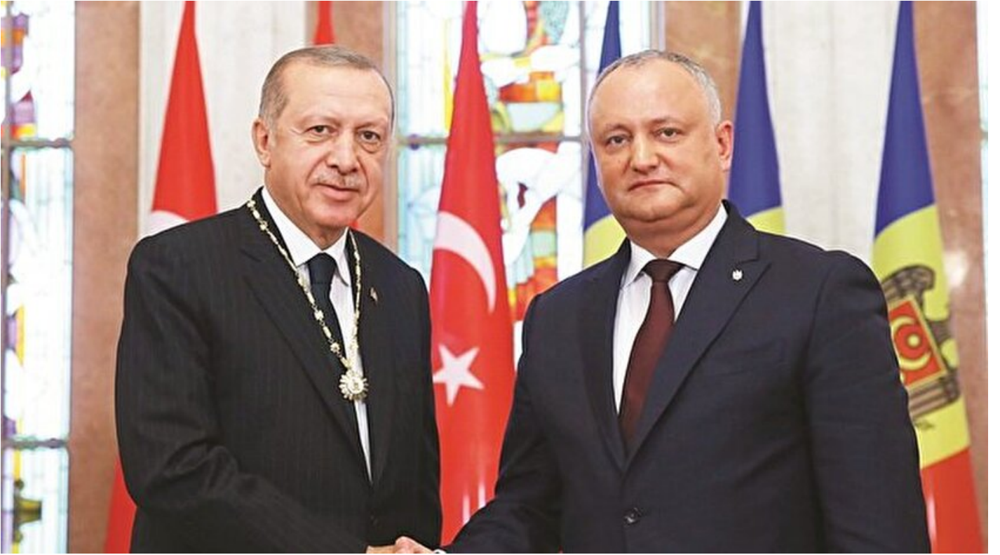
Cumhurbaşkanı Tayyip Erdoğan ve Moldova Cumhurbaşkanı İgor Dodon

Haber Merkezi · 18 Ekim 2018, 04:00 · Yeni Şafak