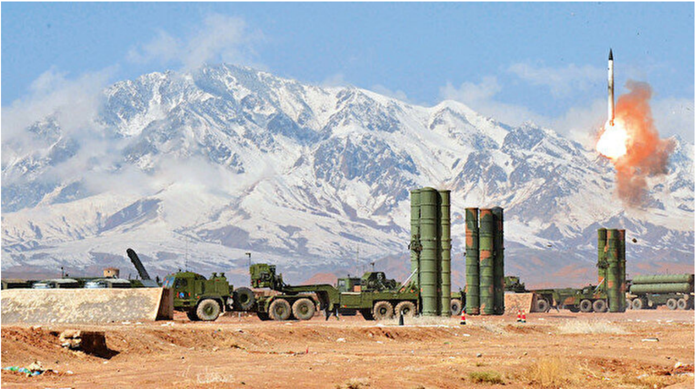
S-400 Hava Savunma Sistemi