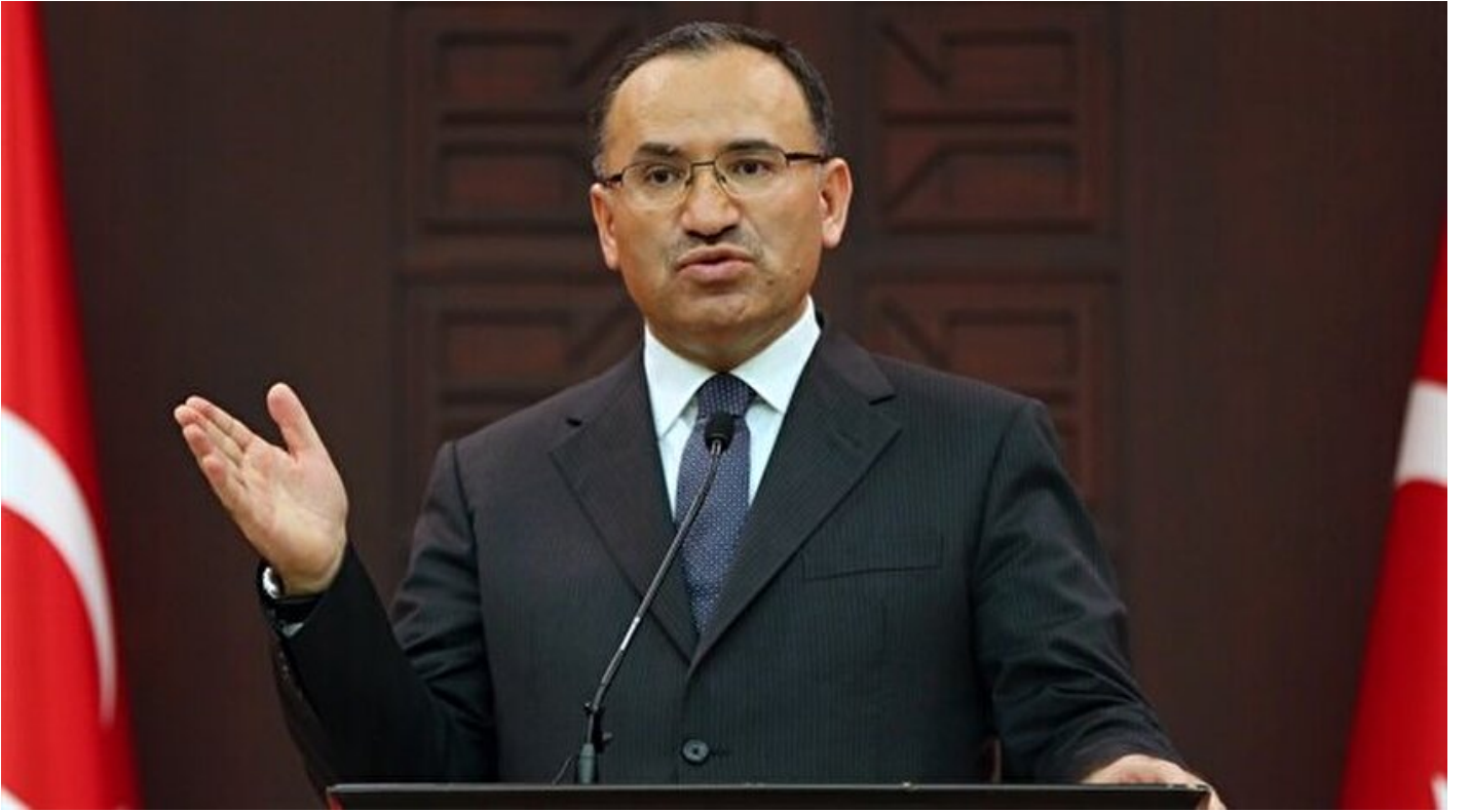
Başbakan Yardımcısı ve Hükümet Sözcüsü Bekir Bozdağ

Haber Merkezi · 27 Mayıs 2018, 18:48 · Son Güncelleme: 27 Mayıs 2018, 18:53 · AA