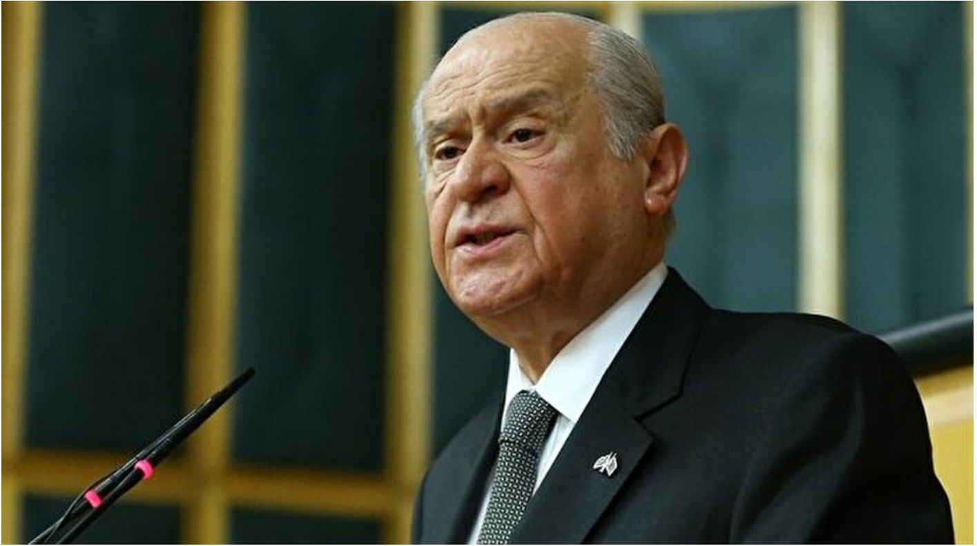
MHP Genel Başkanı Devlet Bahçeli