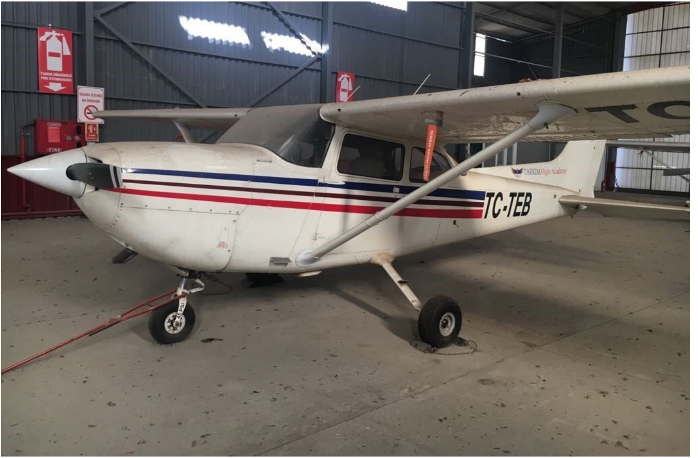
TMSF tarafından satışı çıkarılan uçak.