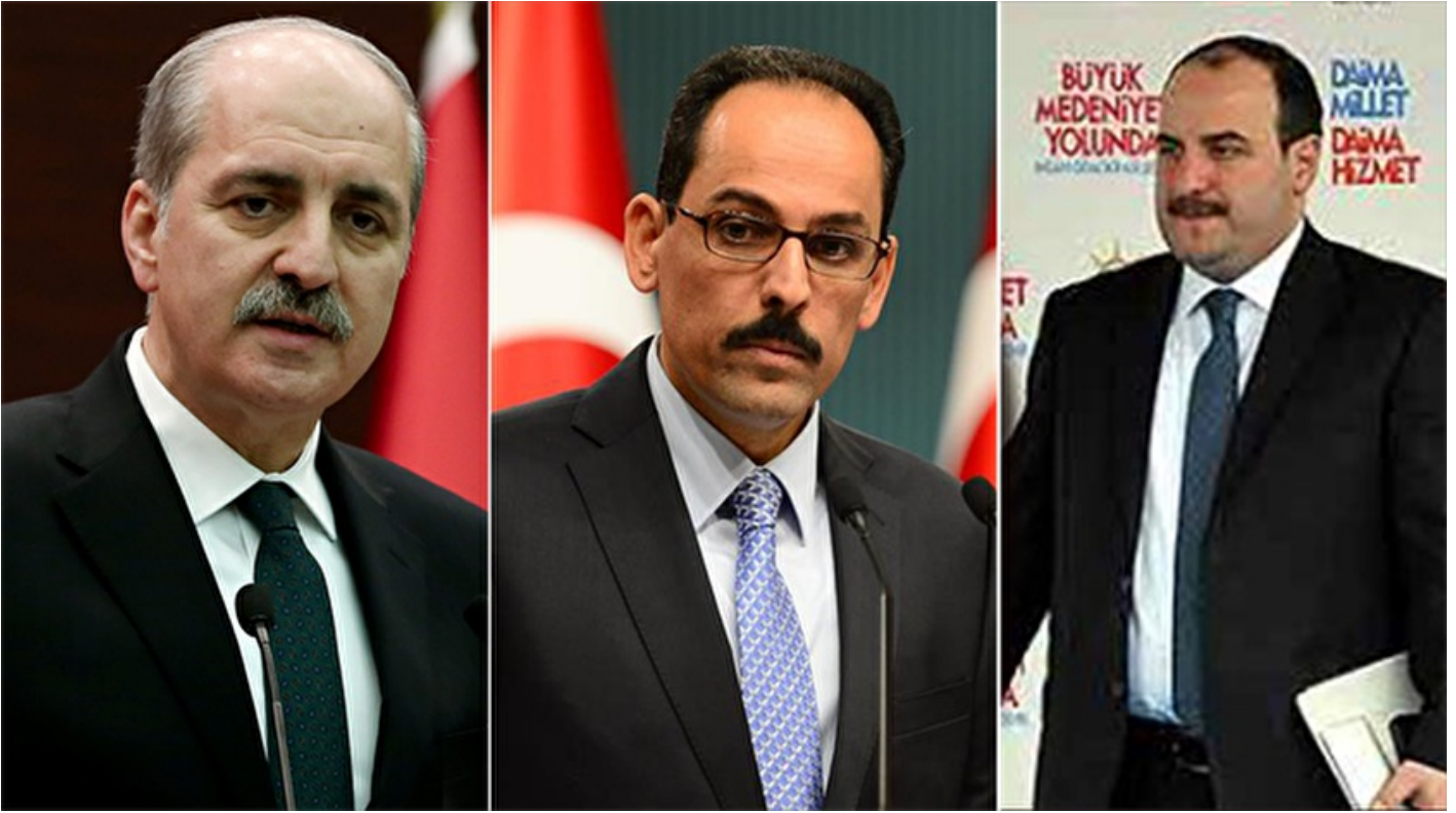
Numan Kurtulmuş, İbrahim Kalın, Mustafa Varank