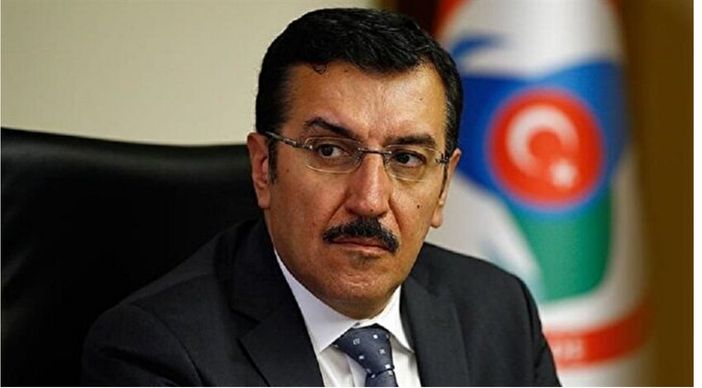
Gümrük ve Ticaret Bakanı Bülent Tüfenkci

Haber Merkezi · 02 Kasım 2016, 09:31 · AA