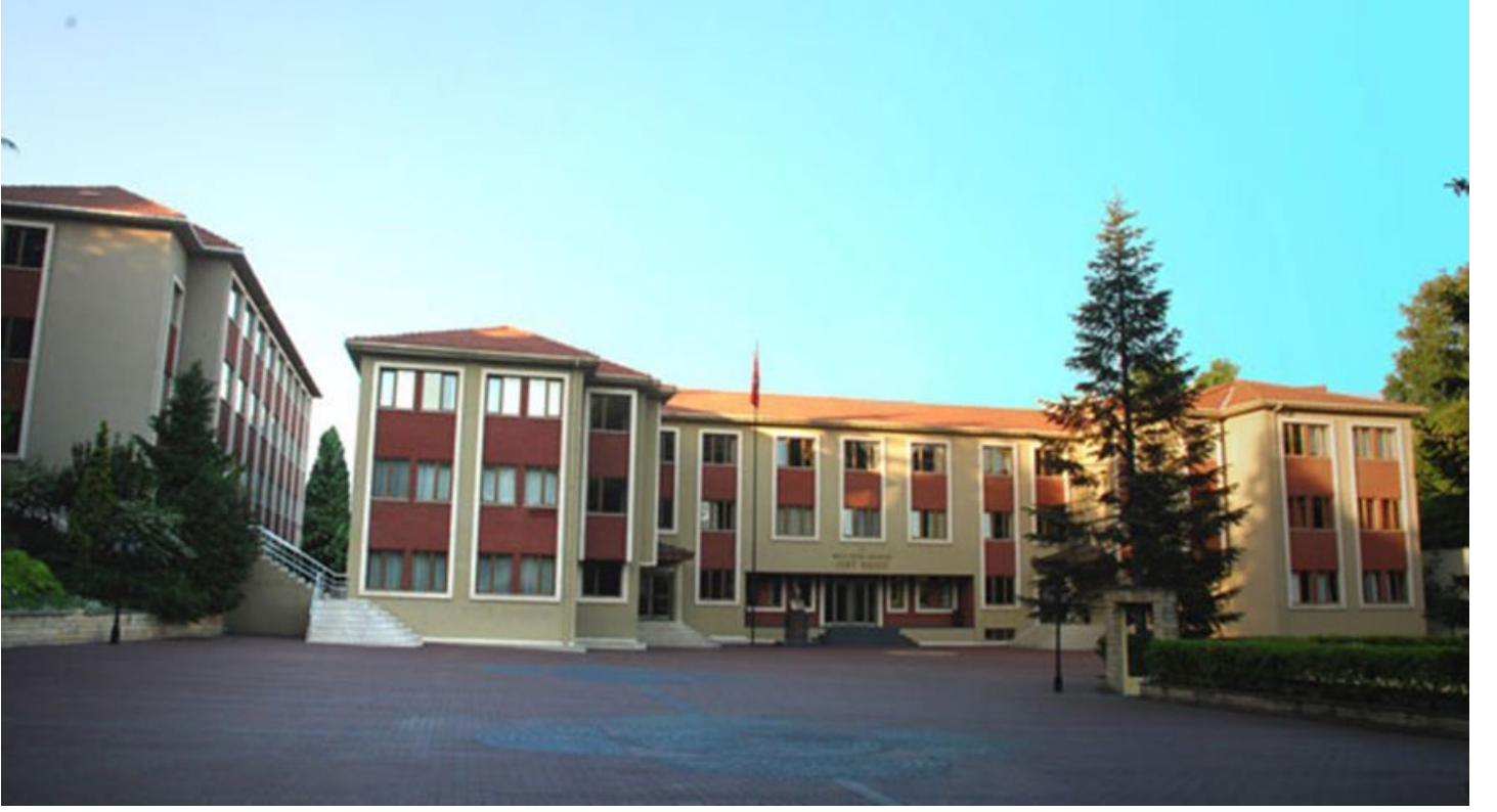
Özel Dost Koleji