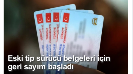
Eski tip sürücü belgeleri için geri sayım başladı