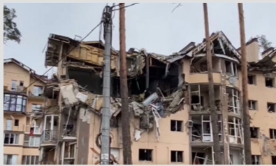
Rus savaş uçakları sivil yerleşim yerlerini bombaladı