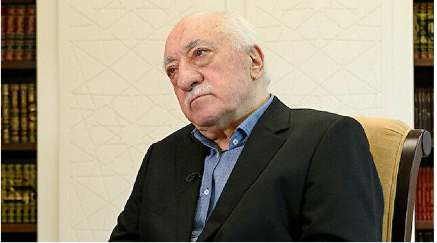
Teröristbaşı Fetullah Gülen