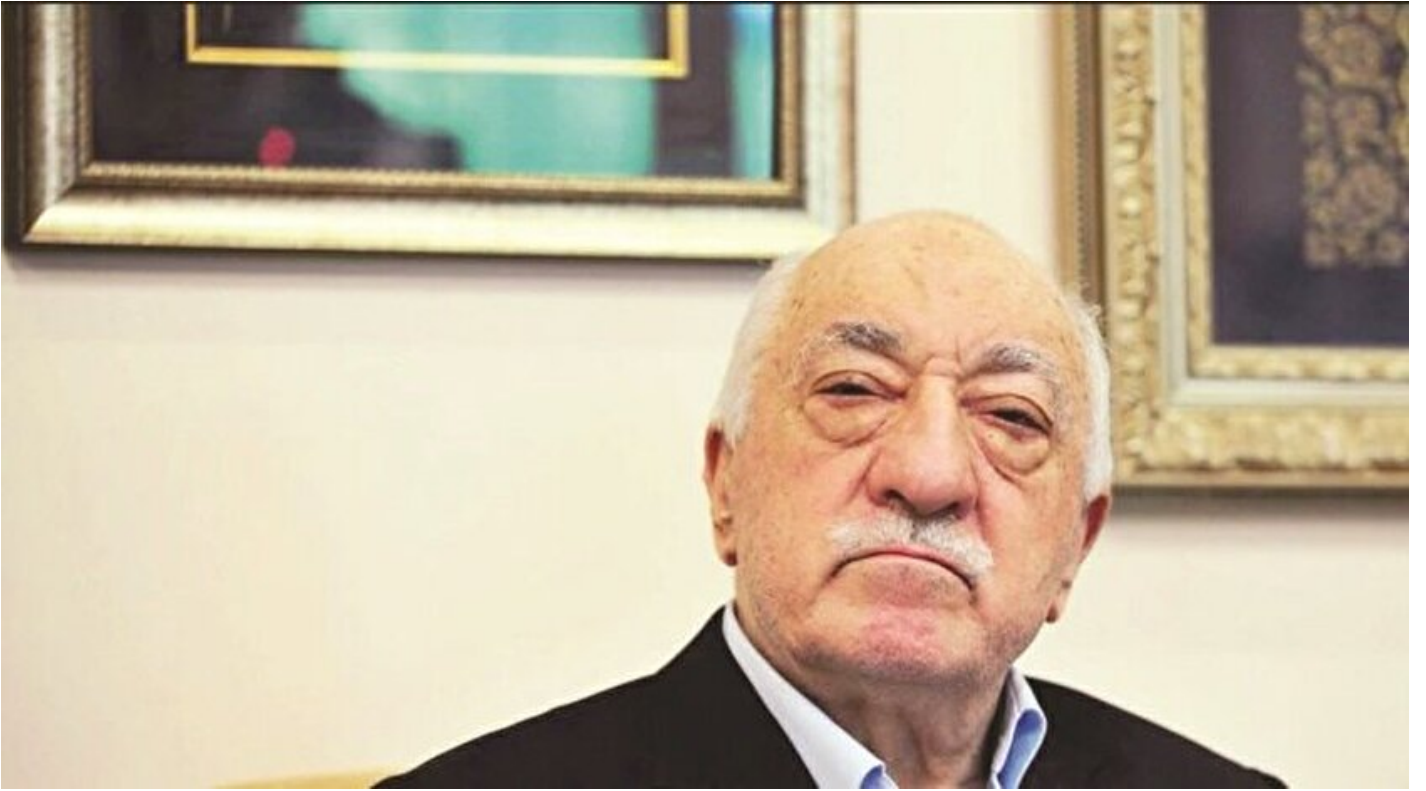
FETÖ elebaşı Fetullah Gülen