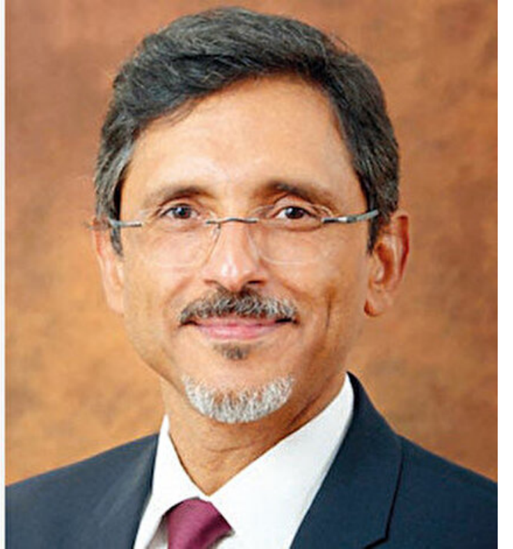
Nadali Pandor ve Ebrahim Patel (Sağda)