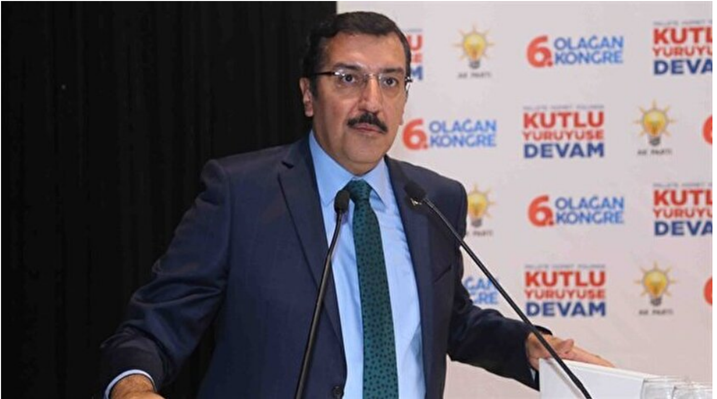
Gümrük ve Ticaret Bakanı Bülent Tüfenkci

Haber Merkezi · 29 Ekim 2017, 18:43 · Son Güncelleme: 29 Ekim 2017, 18:55 · IHA