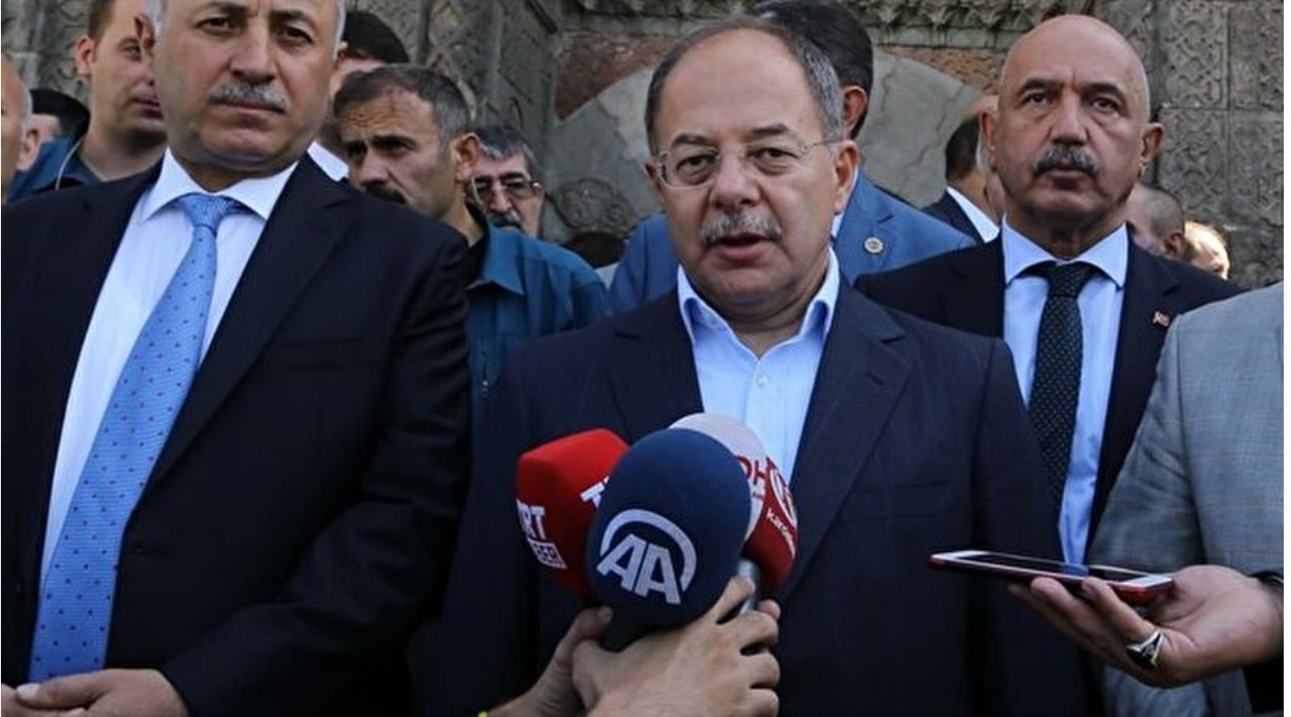
Başbakan Yardımcısı Recep Akdağ

Haber Merkezi · 08 Eylül 2017, 10:15 · Son Güncelleme: 08 Eylül 2017, 11:46 · Yeni Şafak